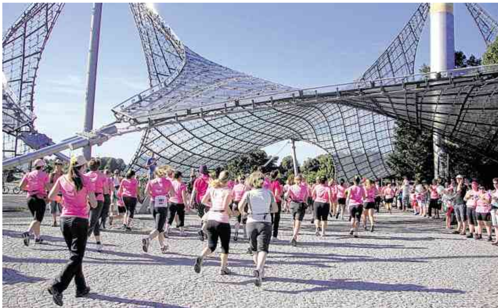
Der Women's Run im Olympiapark – ein Klassiker unter den Frauenläufen.

Nochmals dreht sich alles um Frauen beim „9. Münchner Frauenlauf gegen Brustkrebs“. Rund 200 Meter vom Chinesischen Turm entfernt, liegt auf der Busstraße durch den Englischen Garten der